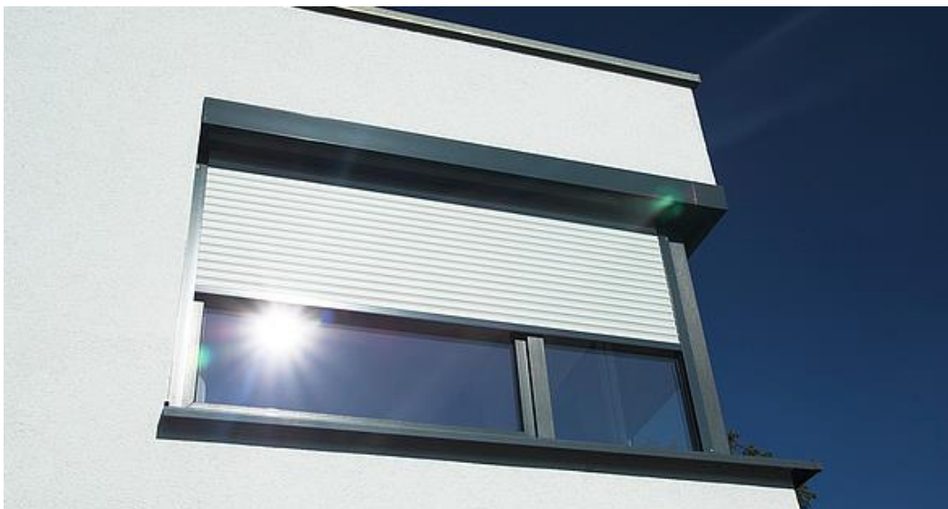
Abb.: Rollladen

Rolety se montují přímo na okno nebo na fasádu a plní funkci zvukové a tepelné izolace, ochrany soukromí a také ochrany před sluncem.